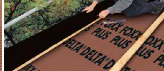
Wiatroszczelne układanie z DELTA®-FOXX PLUS.